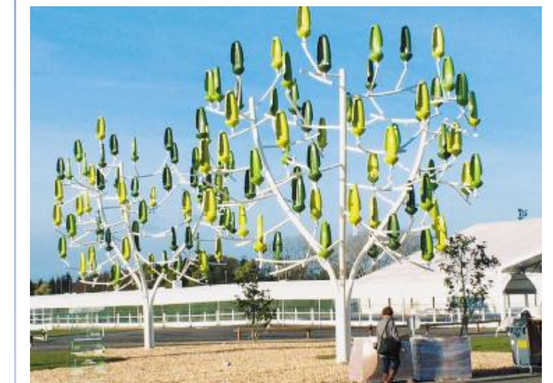
图为城市地区设计的风机树出现在巴黎COP21外。

据悉,该设计早在2014年就被创建了,设计的灵感主要来自如何在城市中建造出与树木类似高度的风电。在城市,阻碍设计的不仅有空间的限制,风力大小也是要考虑的关键因素。